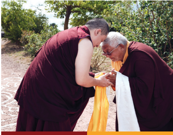
◄ Jigme Rinpoché accueille Karmapa à Dhagpo Möhra (2023)