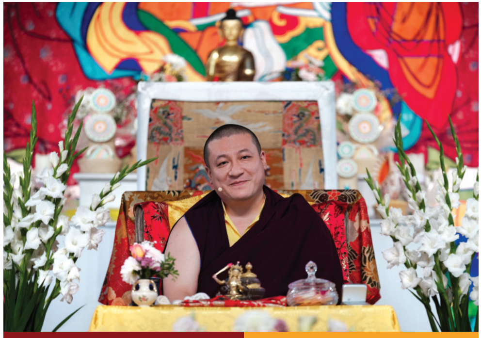
► Sa Sainteté Gyalwa Karmapa Trinley Thaye Dorje à Dhagpo Kagyü Ling (2023)